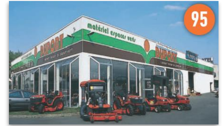
Duport - Baillet-en-France (95)

ZAE de l'Autodrome - RN 20 91310 Linas-Monthlery