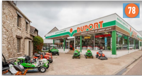
Duport - Arnouville-les-mantes (78)

1 Route de Boenville, 78790 Arnouville-lès-Mantes