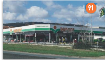
Duport - Linas-Monthlery (91)

1 Route de Boenville, 78790 Arnouville-lès-Mantes