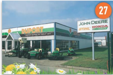
Duport - Saint-Marcel (27)

Dans chacun des quatre magasins, vous trouverez toute l'application DUPORT pour mieux comparer, choisir, essayer et disposer sans attendre.